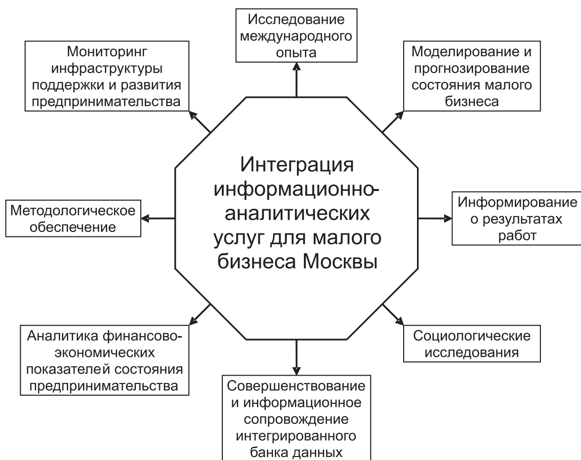
Рис. 2. Основные направления работ ИАУ МЦРП в рамках мониторинга состояния малого бизнеса Москвы

2) мониторинг проблем развития МСП (административных барьеров; финансовых и имущественных проблем; доступа к новым технологиям, знаниям; проблем менеджмента в организации в части управления предприятием, персоналом, финансами и т. д.);